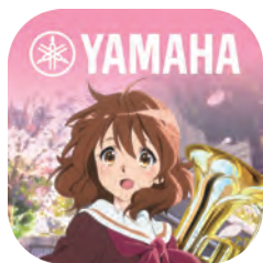
スマートフォンアプリ 「ふこうよアンサンブル 北宇治学園へようこそ」 制作協力 (サンプル演奏手配・録音)