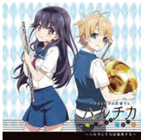
TVアニメ「ハルチカ ～ハルタとチカは青春する～」 吹奏楽協力 (演奏手配・BGM録音)