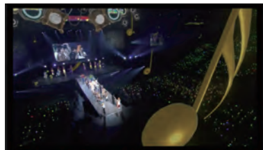
イベント「ニコニコ超パーティー2018」 演出協力 (全体OP・吹奏楽ステージ)