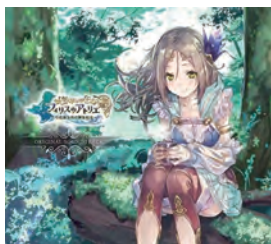
ゲーム「フィリスのアトリエ」 音楽協力 (管弦楽器手配・収録手配)