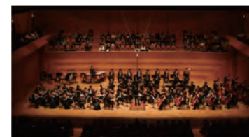
オーケストラ「VIRTUOSO YOUTH ORCHESTRA」 企画・運営協力