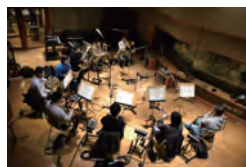
「ホッカイドウ競馬」(門別競馬場) ファンファーレ制作 (演奏・録音手配) 演奏：東京佼成ウインドオーケストラ様